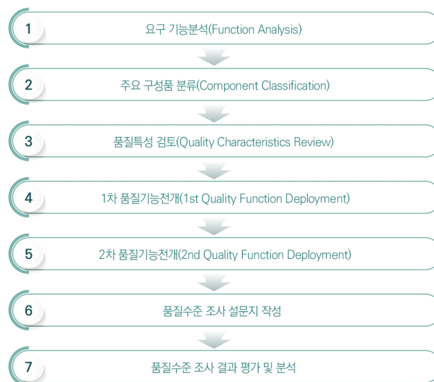
Figure 1. 7 Steps of the suggested framework

본 연구에서는 “국방전력발전업무훈령”(Instruction for National Defense Force Development, 2022)에서 제시하고 있는 전체 10대 무기체계와 관련된 장비나 군수품의 품질수준 조사를 위한 설문지 개발 및 품질수준 진단에 필요한 일반화된 군수품 품질수준 진단 프레임워크를 제시하였다. 제시된 프레임워크는 Figure 1과 같이 조사 대상 장비의 요구 기능분석으로 시작해 주요 구성품 분류, 품질특성 검토, 1차와 2차 품질기능전개 등을 통해 품질수준 체크리스트를 개발하고, 이를 적용한 품질수준 조사 결과를 평가 및 분석하는 7단계 과정으로 구성되어 있다.